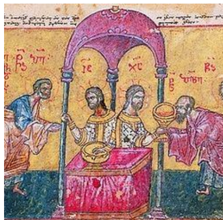
Причащение апостолов. Миниатюра из греко-груз. рукописи XV в.

В некоторых Поместных Православных Церквях в день памяти святого апостола Иакова, 23 октября/5 ноября, служитя литургия по его чину. Это древнейшая литургия и она является творением всех апостолов. Святые апостолы, до того как они не разошлись в разные страны для проповеди Евангелия, собирались вместе для совершения евхаристии. Позже этот чин был зафиксирован письменно под названием литургии апостола Иакова.